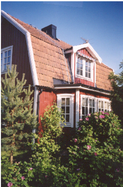
Trä är det traditionella fasadmaterialet i kusten. Eventuellt kan fasaden utgöras av trä i kombination av puts.

Behåll den nuvarande materialkaraktären i området med stående eller liggande träpanel. Trä är enligt tradition det fasadmateriel som passar bäst i kustlandskapet. Det är levande, hållbart och lätt utbytbart, när så behövs. Trä i kombination med puts kan vara ett alternativ.