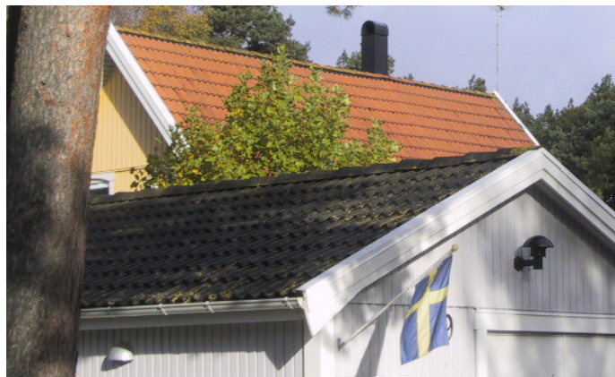
Lämpliga takmaterial i kustområdet är främst tegelpannor. Alternativ kan vara betongpannor eller fibercementplattor.