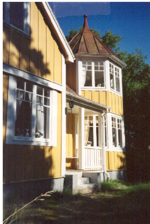
En veranda markerar husets entré.

Planera verandor och uterum tillsammans med huset. Uteplatser och verandor som finns i husets byggnadskropp ger ofta en enklare och mer samlad form och altanen upplevs som en del av huset. Risken är annars att altanen överröstar den egentliga huskroppen.