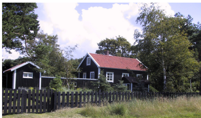
Många hus i kustlandskapet är färgsatta i mörkt bruna eller svarta kulörer.

Leta gärna efter ett vackert färgsatt hus. Fråga vilket nummer färgen har för att hitta exakt samma nyans. Med tiden bleknar färgen och man bör vara medveten om att om huset målas med samma färg kan det ändå upplevas olika beroende på ljusförhållande och färgens ålder.