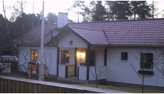
Belysning är viktigt under den mörka delen av året.