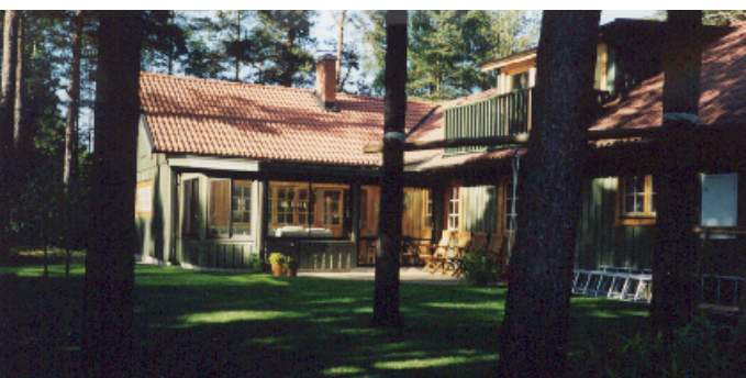
Altaner som anläggs på trädäck skadar inte marken och kan göra att skillnaden mellan ute och inne blir liten.

Utnyttja höjdskillnader för att skapa uteplatser. På så sätt kan skillnaden mellan golvnivån ute- och inne bli liten. Uteplatsen kan anläggas på trädäck så skadas inte marken av omfattande markarbeten.