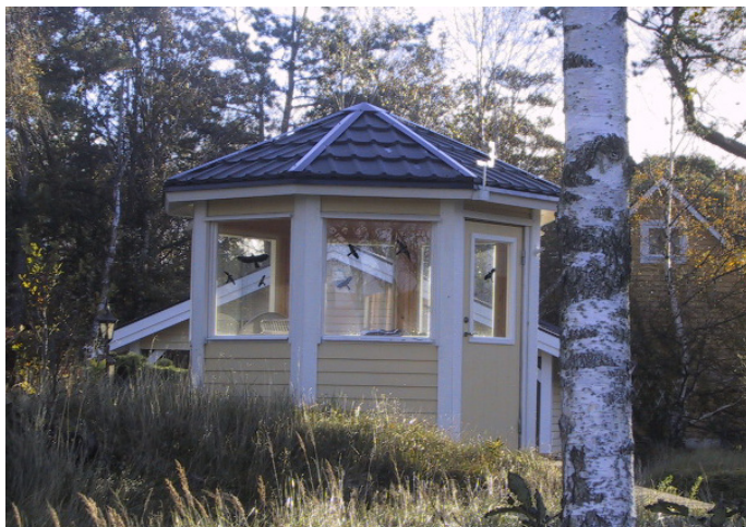
Ett lusthus kan vara ett alternativ till ett uterum. Det placeras fristående från huvudbyggnaden, vilket gör att det lättare kan anpassas till huset och tomten.