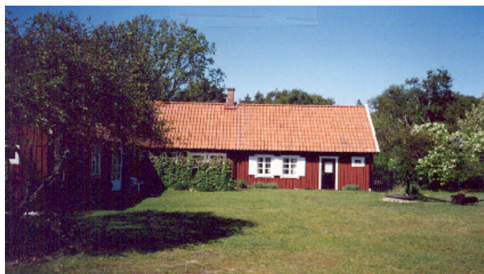
Traditionella fasadfärger i kustlandskapet är falurött, brunt, vitt och gult.