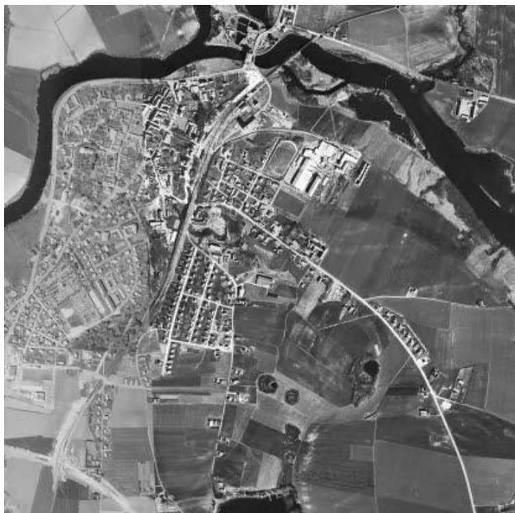
Flygfoto över centrala Laholm 1950.

I området som idag kallas för Stadsparken fanns det långt tidigare en park, som började anläggas redan på 1850-talet. Den växte fram i Tvättebäckens dalgång i de norra delarna av den nuvarande Stadsparken och kallades för Tivoli - en äldre benämning för en plats för nöjen och gärna i lummig grönska. Över slingrade grusgångar (kärleksstigen) mellan träden och runt dammen flanerade människor som lockades till dansbanan och Tivolipaviljongen där musikkapellens konserter gav glans åt Stadsparken.