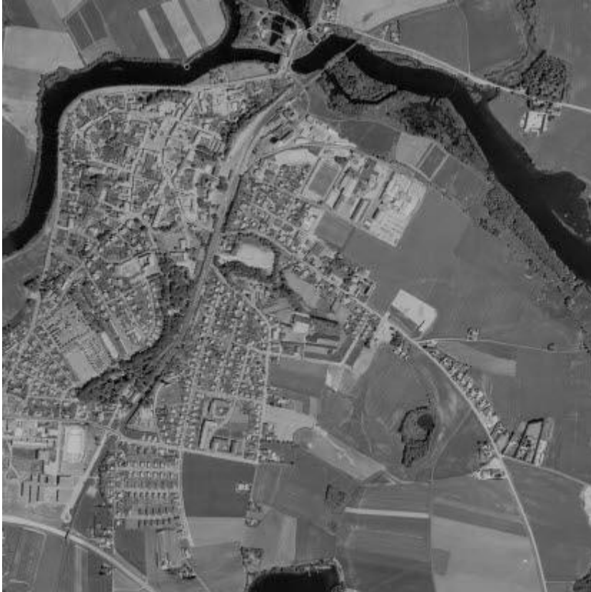
Flygfoto över centrala Laholm 1970.

Under 1980-talet började det pratas om dubbelspår och att tågbanan, som då gick rakt genom parken, skulle flyttas. 1996 gick det sista tåget genom staden och 2007 togs beslutet att anlägga en park även norr om den gamla parkdelen.