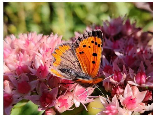
Kärleksört med guldvinge