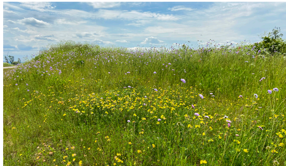
Käringtand och åkerved