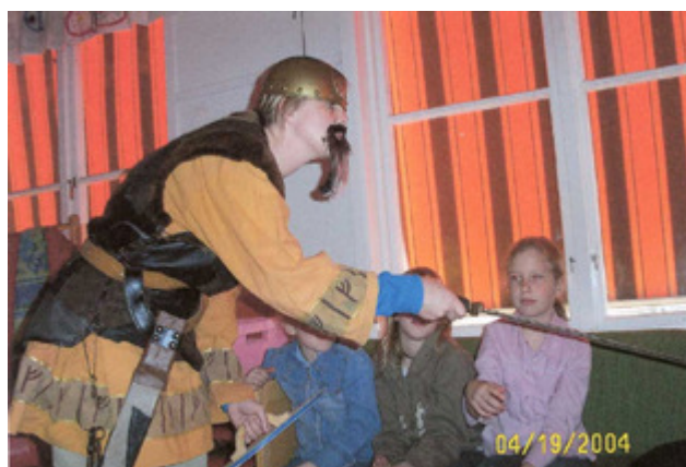
Möte med en viking

någon ropade på hjälp. Jag gled av cykeln och mycket riktigt där inne i skogen stod en mycket märklig man, först förstod jag inte alls vad han sa men efter en stund ändrade han sitt språk så jag kunde förstå honom. Han frågade om jag hade sett hans båt ett 20 meter långt skepp med ett drak huvud längst fram, ett stort segel och många roddare. Han berättade att han var ute på en handelsresa och han hade trillat över bord och hamnat långt under vattenytan och han trodde först att han skulle drunkna för han svimmade av, men när han vaknade låg han nere