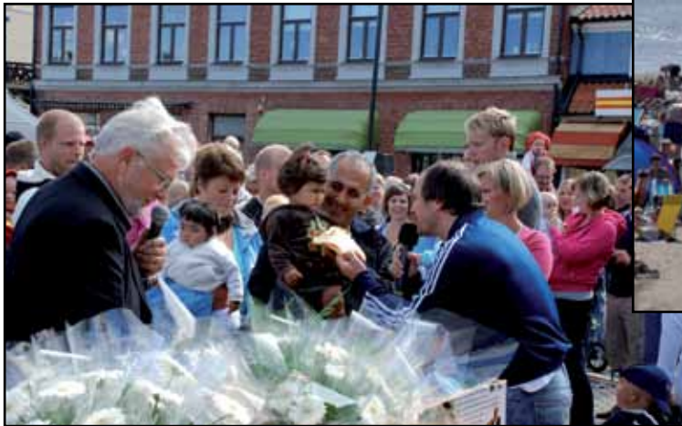
Fête de la ville à Laholm