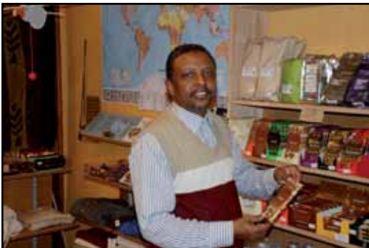
Stage professionnel dans un des magasins de Laholm

Le Centre de formation « Lärcentrum » à Laholm a un service d'orientation qui peut vous aider dans vos choix d'études et de carrière. Ici, vous pouvez parler de votre avenir avec des conseillers d'orientation professionnels. Lärcentrum est également un lieu de rencontre pour entrer dans le monde du travail, grâce à une coopération active avec le Service de l'Emploi « Arbetsförmedlingen » et les entreprises locales.