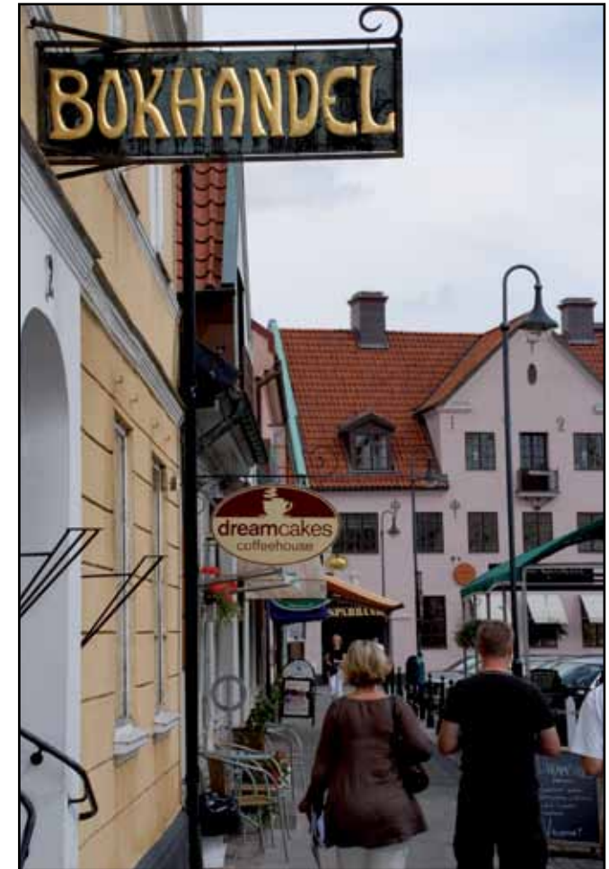
Le centre de Laholm

« Diverses activités sont organisées tout au long de l'année dans le centre chaleureux de Laholm, comme la fête de la ville, des soirées à thème en été, le marché de produits anciens etc. Il y a aussi un marché presque tous les jours, avec du poisson, des fleurs et des vêtements »