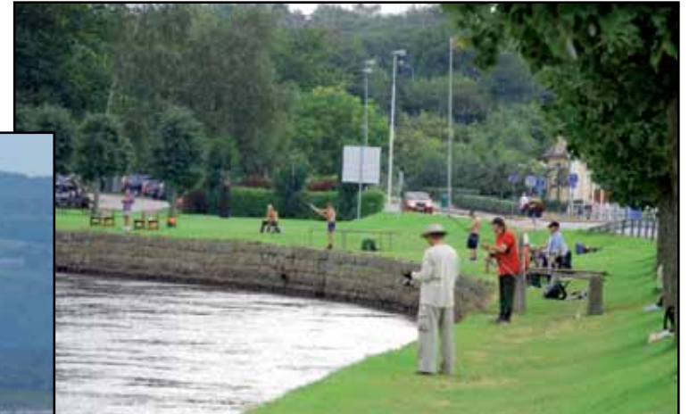
Pêche au saumon dans la rivière Lagan