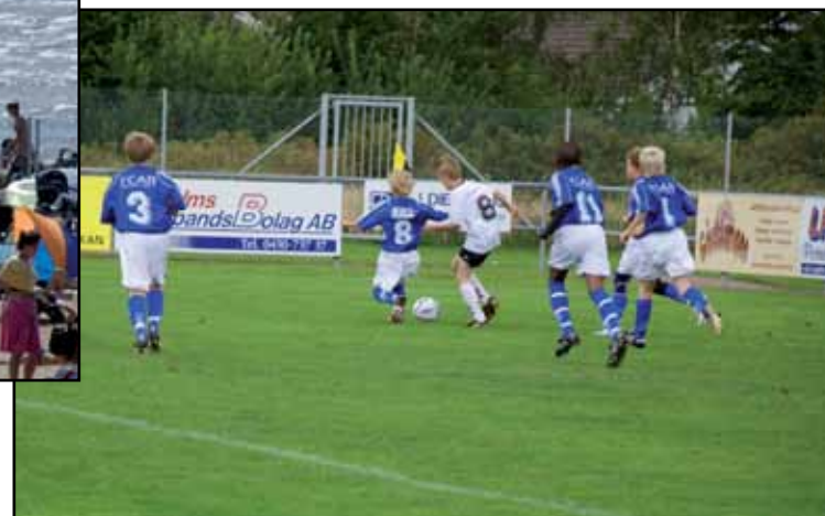
Футбольный матч в парке Гленнинге (Glänningepark)