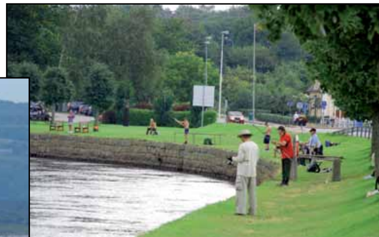
Ловля лосося, река Лаган (Lagan)