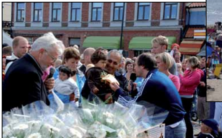
День города в Лахольме