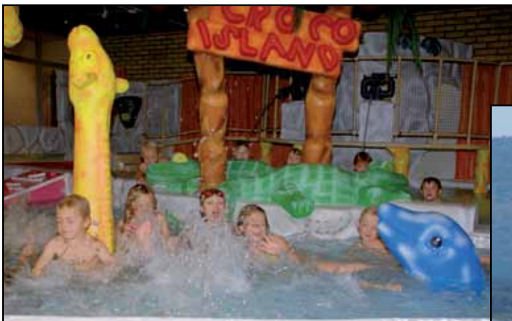
Купальня Центра здоровья (Folkhälsocentrum)