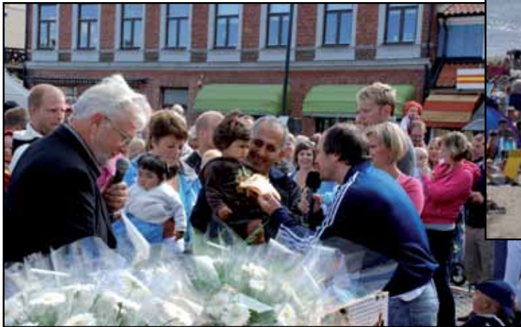
Stadsfesten i Laholm [Waa goob xafladaha lagu dhigo]