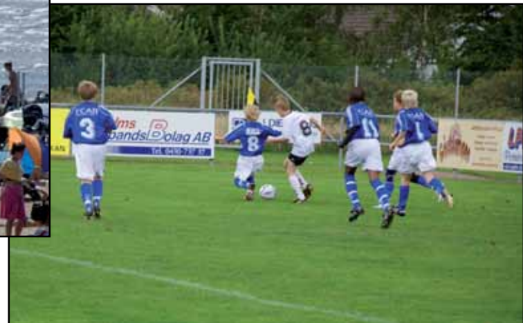
Fotbollsmatch på Glänningepark [Waa goob kubbada cagta lagu ciyaaro]