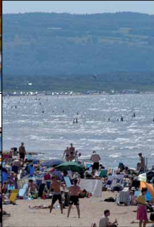
Mellbystrand [Waa goob xeeb ah]