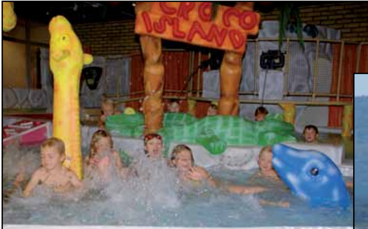
Folkhälsocentrums badland [Xarunta arrimaha caafimaadka ee ummadda]