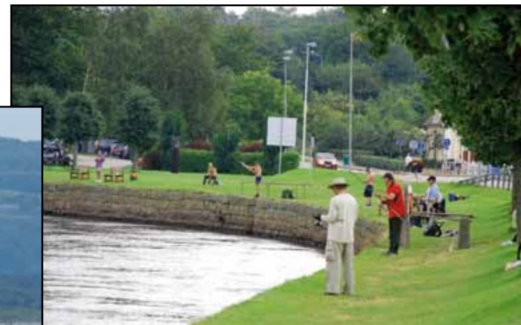
Laxfiske vid Lagan