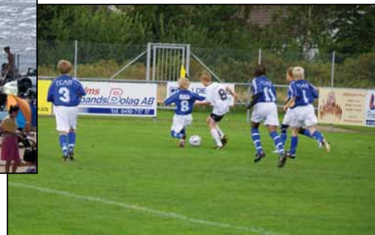
Fotbollsmatch på Glänningepark