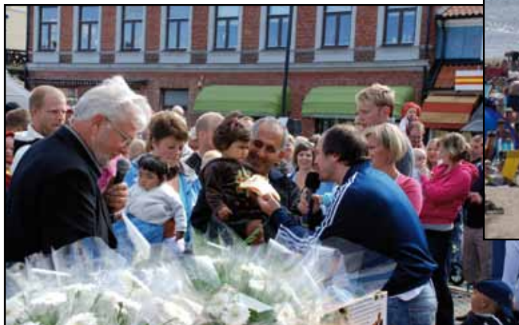
Stadsfesten i Laholm