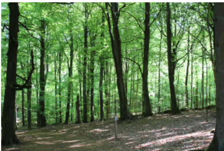
Bokskogen Hallandsåsen, Båstad, Laholm

Du är inte ensam, vi finns för dig. Hör av dig till oss.