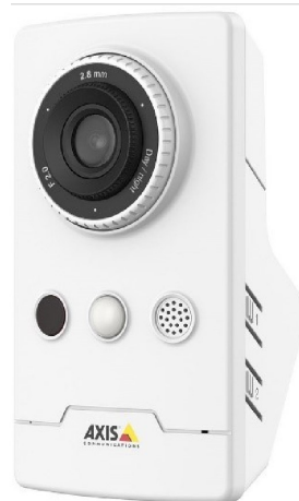
Bilden visar hur Trygghetskameran som installeras i ditt hem kan se ut.